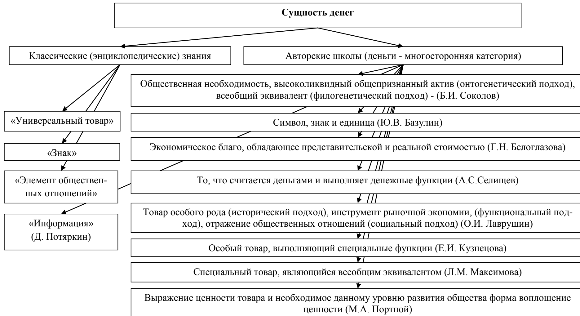
Рис. 4. Сущность денег в современных отечественных экономических школах