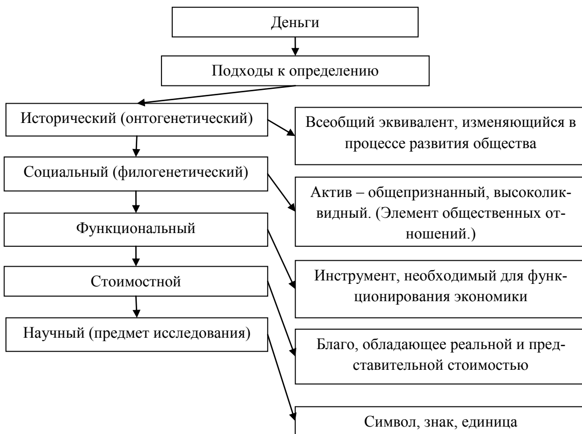
Рис. 2. Подходы к определению денег в современной отечественной экономической теории

Низшая форма кредитных денег – вексель (долговое обязательства, дающий его владельцу беспорное право требовать с лица, выдавшего или акцептовавшего данное обязательство, уплаты денег по истечении его срока) и банкнота (в отличие от векселя представляет собой обязательство банка). Высшая форма – депозитные деньги (запись на счетах, в них ценность действительна благодаря действию определенных общественных правил). Финансовые деньги служат средством выражения ценности источников дохода, представленных на фондовом рынке в виде ценных бумаг как товара и обслуживающие процесс накопления. Они не предъявляются как претензия на товары. Для этого их надо превратить в кредитные деньги.