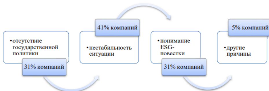
Рис. 2. Ключевые проблемы отечественных предприятий при внедрении элементов концепции ESG в систему менеджмента

Таким образом, ключевыми проблемами отечественных предприятий при внедрении элементов концепции ESG в систему менеджмента является неопределённость ситуации в экономическом развитии страны с политического государственного уклада. Также ряд проблем при внедрении элементов концепции ESG связан с