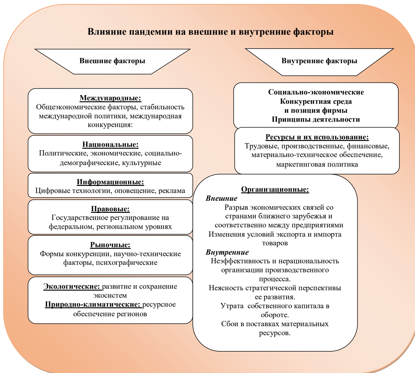
Рис. 1. Влияние пандемии на внешние и внутренние факторы в условиях кризисного управления

Анализ рисунка показывает, что пандемия COVID-19 является наиболее довлеющим фактором на все элементы макро- и микросреды. В связи с этим необходимо определить какие возможные пути решения социально-экономических, эколого-биологических проблем могут быть применены и уже действуют в первую очередь. Ряд исследований, которые уже появились в экономической литературе прогнозируют несколько вариантов решения данной проблемы [3].