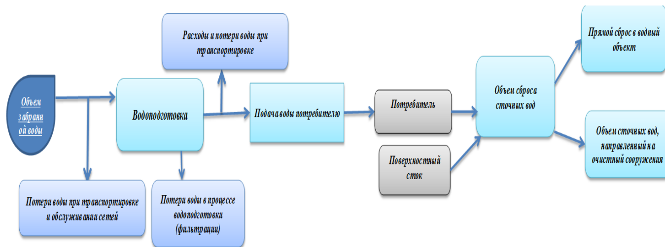
Рис. 2. Распределение воды и сточных вод по предприятию ГУП «Водоканал СПб» (основной технологический цикл)

На рис. 2 приведены основные технологические процессы, характерные для предприятия ГУП «Водоканал СПб»(схема базируется на данных источника[12]).