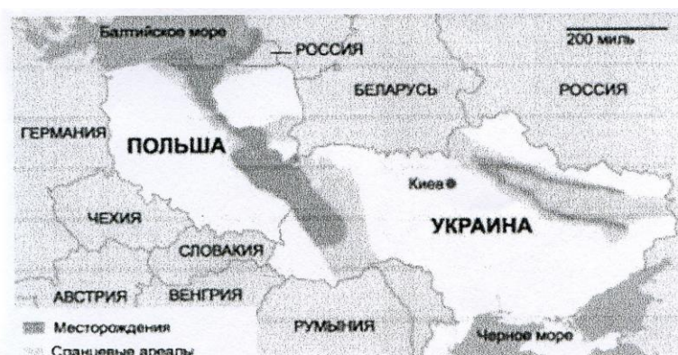
Рис. 3 Перспективные месторождения сланцевого газа Люблинского угольного бассейна и Днепровско-Донецкой впадины, Агентство по энергетической информации США

В ближайшее время Украина планирует заключить контракты на совместные работы с компаниями: ENJ, Exxon Mobil и др.