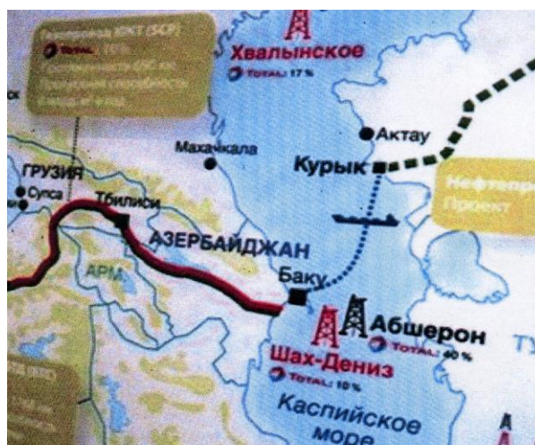
Рис. 1 Маршрут транскаспийского газопровода.

Предполагается, что ТКГ соединит Туркменский и Азербайджанский берега Каспийского моря по маршруту: Актау (Казахстан) – Туркменбаши (Туркмения) – Баку (Азербайджан), далее по газопроводу «Nabucco», с транспортировкой 20-30 млрд. м 3 в год ПГ.