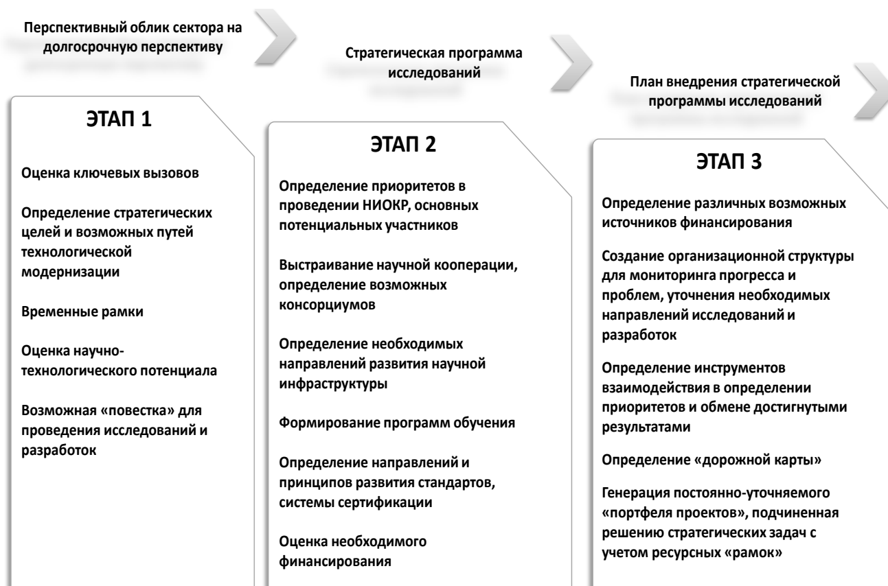
Рис.2 - Основные стадии формирования и развития центров технологического девелопмента (ЦТД).

Предназначение центров технологического девелопмента (ЦТД) в России представлено на рис.3.