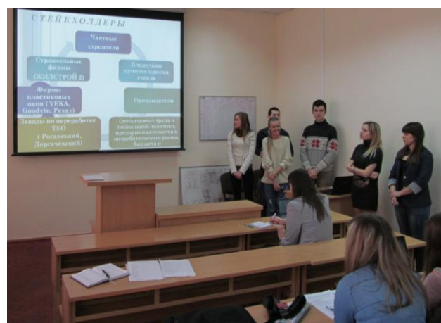
Студенты ХНУ имени В.Н. Каразина и ХНУГХ имени А.Н. Бекетова на интерактивных занятиях

Подведение итогов и обратная связь. В завершение курса студентам было предложено заполнить анкету обратной связи, состоящую из 11 вопросов. Опрос проводился в анонимной форме.