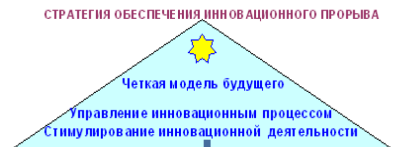
Рисунок 2 – Стратегии обеспечения инновационного прорыва

Данная политика может быть успешной только при наличии четкой модели будущего, грамотного и эффективного управления инновационного процесса и адекватной текущей ситуации системе стимулирования инновационных процессов (рисунок 2).