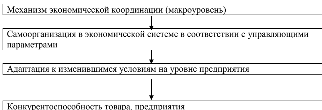
Рис. 1. Общий механизм экономической координации стран

Общий механизм экономической координации стран, показанный на рис. 1, представляет собой функционирующую конкурентную среду, в которой будут присутствовать два механизма: централизованной (плановой) и децентрализованной (рыночной) координации.