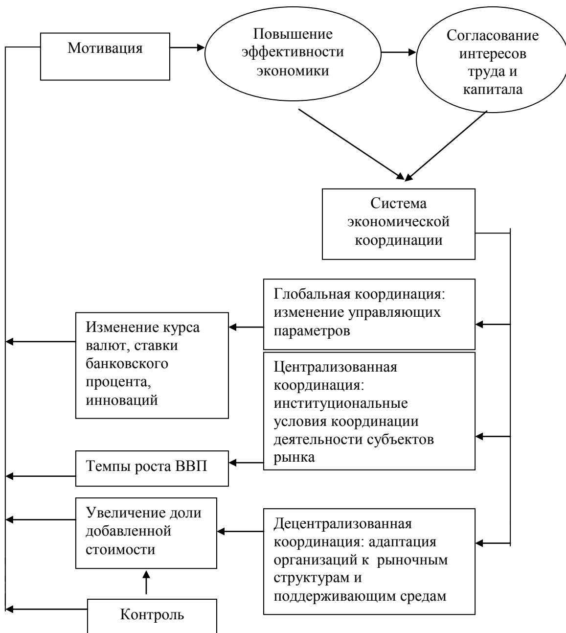
Рис. 4. Модель управления процессом формирования конкурентной среды в России.