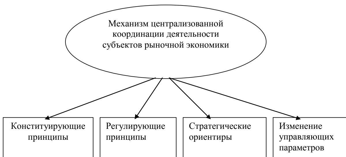
Рис. 2. Механизм централизованной координации субъектов рынка

К институциональным условиям хозяйствования мы относим научно-техническую базу производства и квалифицированную рабочую силу. Кроме того, мы включили в централизованную координацию степень зависимости страны или региона от международного обмена и возможностей влияния на него.