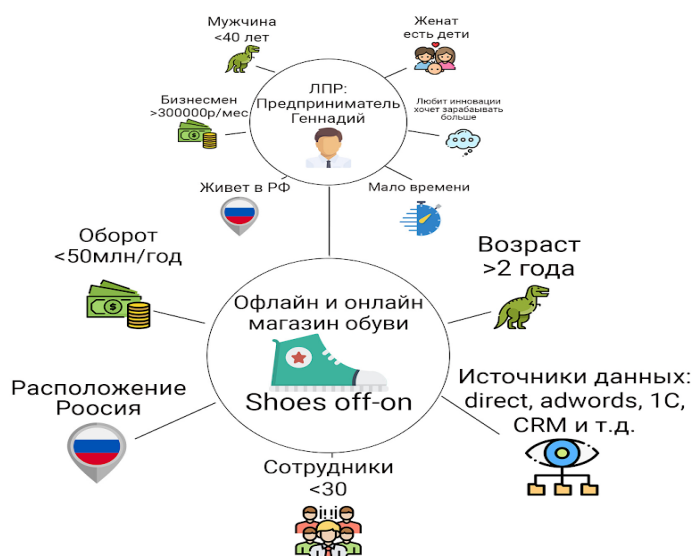
Рис. 3. Портрет потребителя InteGrow BI

2. Так как данные вводятся вручную, возникает человеческий фактор, который включает в себя либо опечатки, либо дублирование одной и той же информации разными символами. Система воспринимает такие ячейки каждый раз по-разному, что также не позволяет корректно выводить нужные показатели.