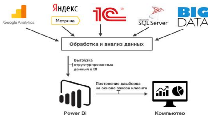
Рис. 1. Принцип работы BI-платформы на примере MS Power BI

Преимущества платформы Microsoft перед аналогами заключается в универсальности (можно подключить любой тип данных), разнообразии визуальных элементов, а также сравнительно недорогом лицензировании (бесплатно или 9.99 долларов по курсу плюс НДС ежемесячно за одного пользователя для версии Pro, предоставляющей возможность совместной работы, разграничение доступов, создание рабочих групп). Power BI является оптимальным вариантом не только для малого и среднего бизнеса, но для крупных организаций с большими объемами данных. И хотя Power BI — экономичное решение, на протяжении 12 лет исследовательская и консалтинговая компания Gartner объявляет ее лидером среди аналитических платформ и платформ для бизнес-аналитики (рис.2).