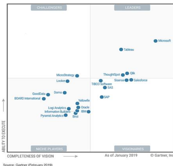
Рис. 2. Магический квадрант по аналитике и BI-платформам [7]

Преимущества платформы Microsoft перед аналогами заключается в универсальности (можно подключить любой тип данных), разнообразии визуальных элементов, а также сравнительно недорогом лицензировании (бесплатно или 9.99 долларов по курсу плюс НДС ежемесячно за одного пользователя для версии Pro, предоставляющей возможность совместной работы, разграничение доступов, создание рабочих групп). Power BI является оптимальным вариантом не только для малого и среднего бизнеса, но для крупных организаций с большими объемами данных. И хотя Power BI — экономичное решение, на протяжении 12 лет исследовательская и консалтинговая компания Gartner объявляет ее лидером среди аналитических платформ и платформ для бизнес-аналитики (рис.2).