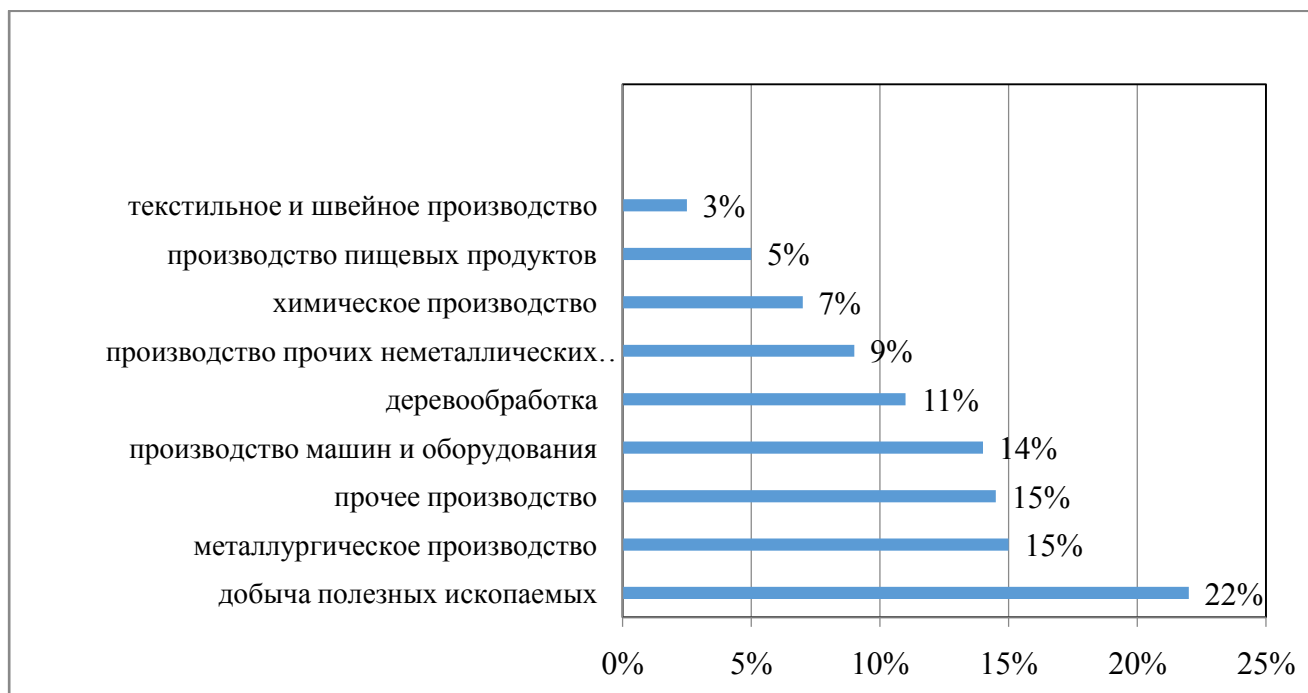
Рис. 1. Распределение градообразующих предприятий по отраслям специализации, %