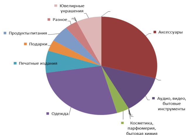
Рис.2. Структура франшиз в секторе торговли Республики Башкортостан[4]

Структура франшиз в сфере торговли Республики Башкортостан может быть представлена следующим образом.