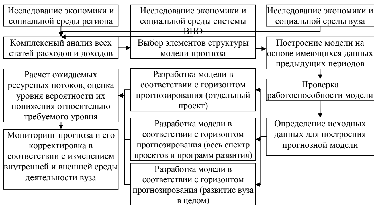
Рис. 1. Основные составляющие методики прогнозирования деятельности вуза на уровне региона

Далее по ряду ретроспективных данных строится предварительная расчетная модель прогноза результатов деятельности вуза в регионе для реализации целей по проверке соответствия полученных на основе прогноза фактическим ресурсным потокам вуза. После проведения отладки модели прогноза ее корректируют на основе учета полученных экспертных оценок, а также применяют для построения прогнозов на фиксированное число периодов применительно к установленным пределам горизонта планирования деятельности вуза в регионе [8]. Далее проводится периодический мониторинг результатов стратегического развития вуза в регионе с целью осуществления учета всех происходящих изменений внутренней и внешней среды ведения научной и образовательной деятельности вуза.