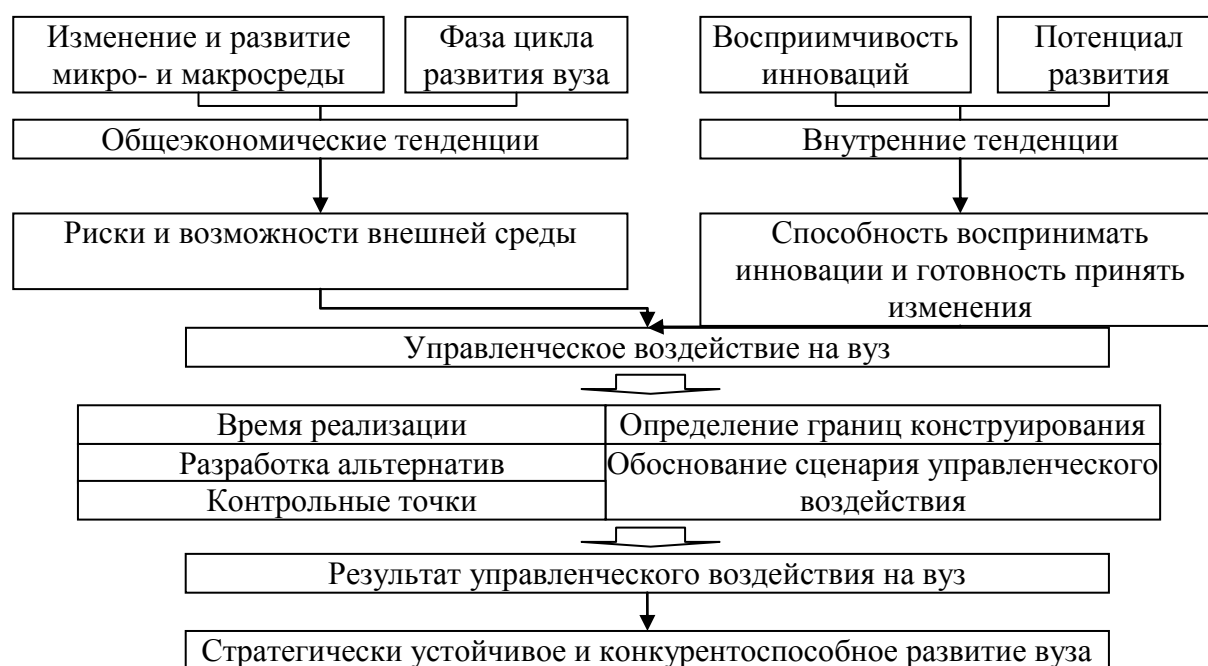
Рис. 4. Основные составляющие методики определения эффективных управленческих воздействий на деятельность вуза

Следует также отметить, что комплексное взаимодействие составляющих методики определения эффективных управленческих воздействий обеспечивает устойчивое экономическое развитие всего вуза в целом. Результативность реализации данной методики определения эффективных управленческих воздействий связана не только с функционированием и взаимодействиями отдельных составляющих методики, которые объединены в блоки в соответствии с функциональным признаком, а также с синергетическим эффектом, производимым системой управления вузом, по факту учета изменения факторов региональной экономики.