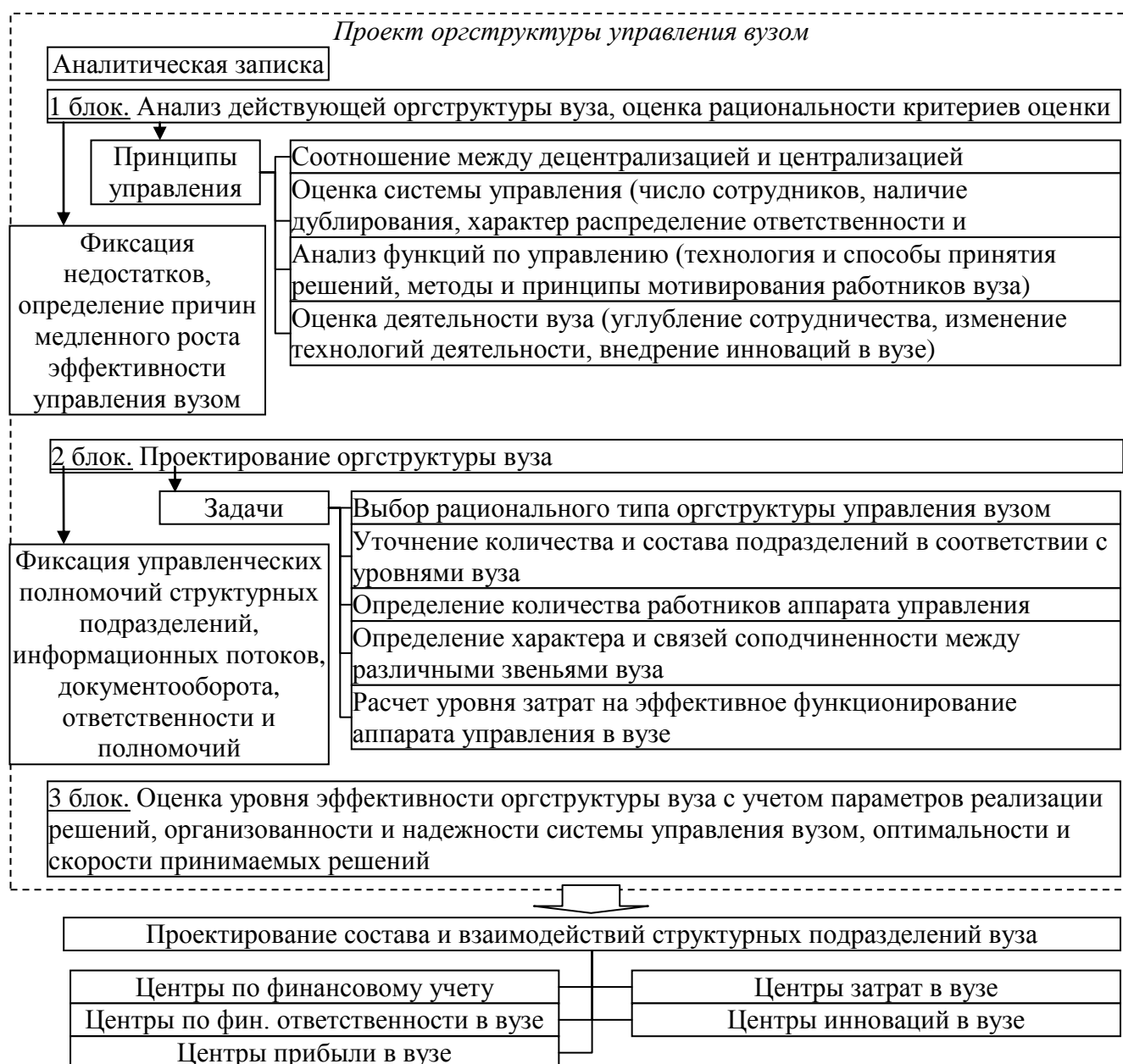
Рис. 3. Основные составляющие методики организационного проектирования вуза в регионе

Смысл выделения и группировки специализированных центров в вузе в рамках организационного проектирования связан с тем, что это обеспечивает возможности эффективного использования современных способов системной трансформации организационной структуры вуза по критерию ее большей рациональности и эффективности [21]. Подобная перегруппировка, которая осуществляется на основе помощи центров по финансовому учету, позволяет, кроме прочего, укрупнить ряд подразделений вуза за счет устранения более мелких. В свою очередь, выделение центров по финансовой ответственности позволяет например, решить на уровне вуза проблему, связанную с возникновением конфликта интересов и монополистических тенденций применительно ко внутренней среде вуза [22].