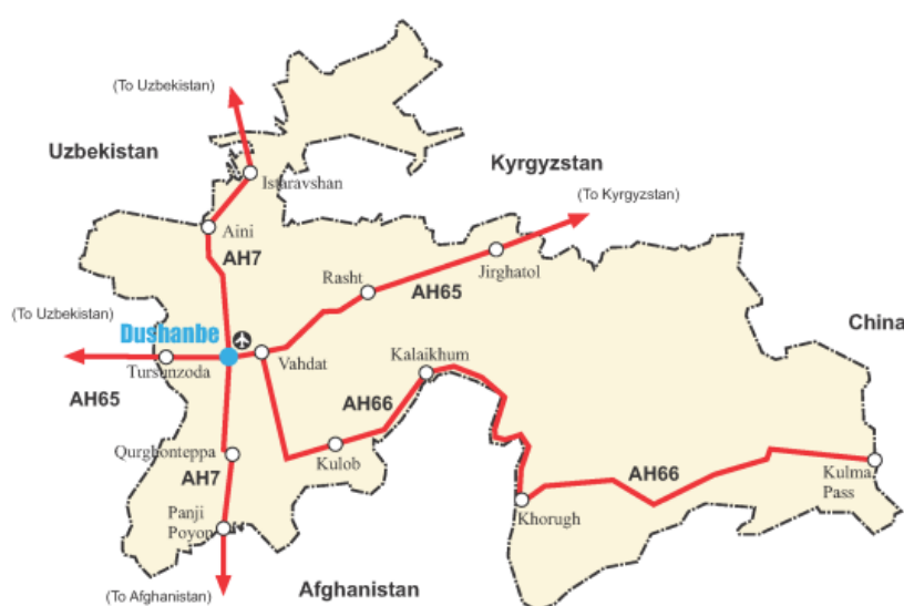
Рис.1. Азиатские автомобильные дороги Таджикистана.

Через республику проходят три азиатские магистрали (АМ) (Рис.1). Душанбе является центральной точкой и узлом коммуникаций для всех магистральных маршрутов. АМ-7 простирается с севера на юг и служит окном в Южную Азию через Афганистан. АМ-65 простирается с востока на запад, связывая таджикско-кыргызские и таджикско-узбекские автодорожные сети. АМ-66 пролегает через центр республики до Душанбе и уходит вверх по направлению к таджикско-китайской границе на перевале Кулма и является самой длинной автодорожной артерией республики.